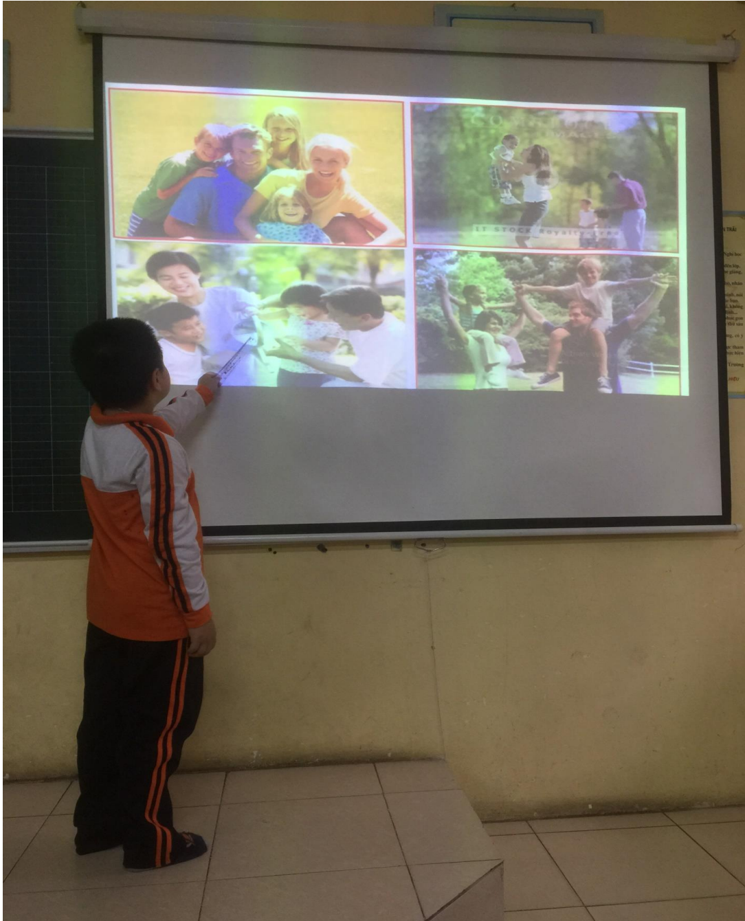
Hình ảnh các bạn đại diện nhóm nêu ý kiến

Qua việc trình chiếu nội dung của bài tập, các bạn học sinh được cùng nhau thảo luận và nêu ý kiến, trao đổi để tự rút ra bài học cho bản thân “Con cháu phải có bổn phận quan tâm, chăm sóc ông bà cha mẹ và những người thân trong gia đình. Sự quan tâm chăm sóc của các em sẽ mang lại niềm vui hạnh phúc cho mọi người trong gia đình”