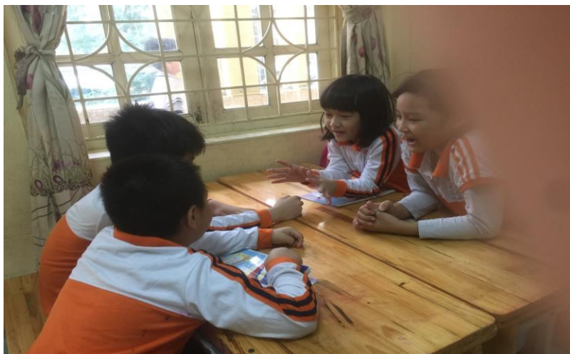
Hình ảnh các nhóm cùng nhau thảo luận