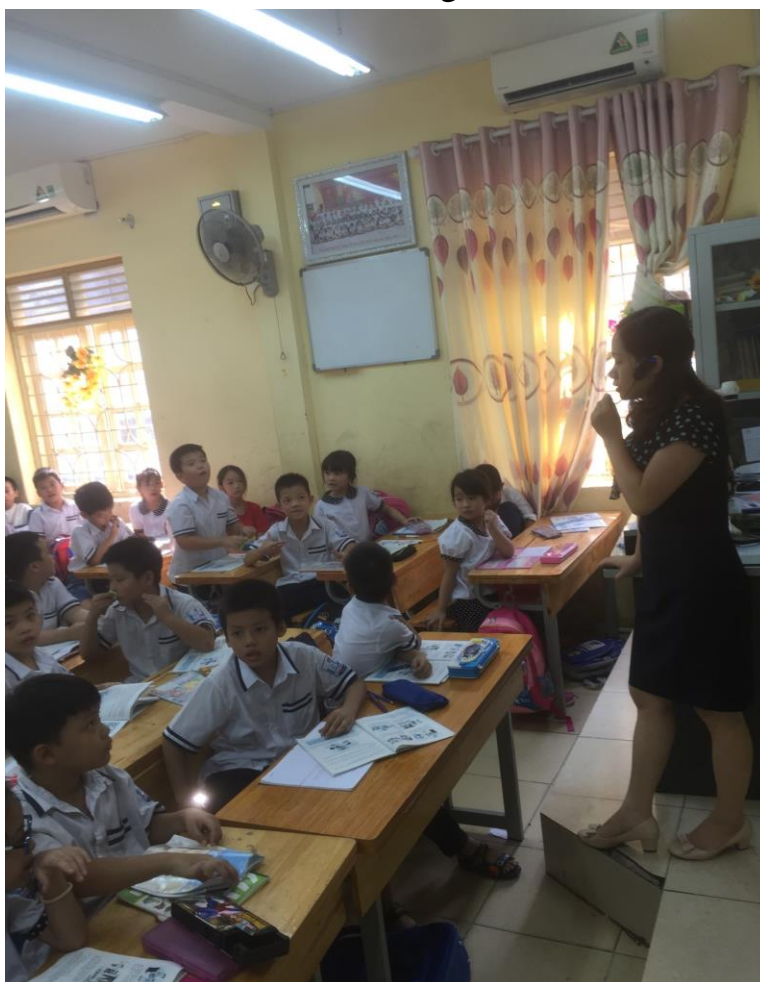
Học sinh xử lí tình huống thực tế qua bài học một cách thuyết phục.